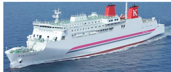
シルバープリンセス

《青森⇔苫小牧 モデルスケジュール》 行き：八戸港 22:00 発 帰り：苫小牧港 23:59 発